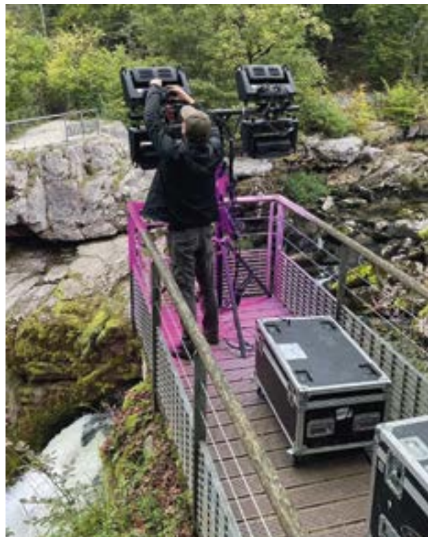
Installation des projecteurs au Saut du Doubs

Grâce à l'implication des bénévoles et des associations locales, le Saut Pink Trail et la Crazy Pink Run , organisée le 14 octobre à Morteau, ont permis de collecter 20 100 euros au profit des associations œuvrant pour la prévention et l'accompagnement des malades.