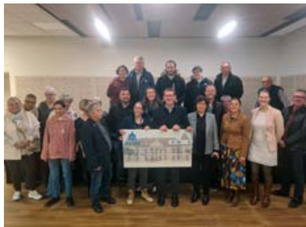
Remise du chèque à Morteau