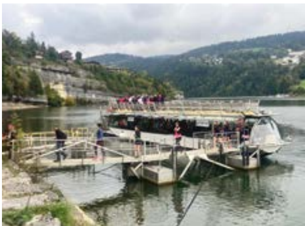
Les coureurs arrivant au Restaurant du Port

Villers-le-Lac et Morteau ont ainsi démontré que sport, solidarité et citoyenneté pouvaient se conjuguer pour une cause essentielle.