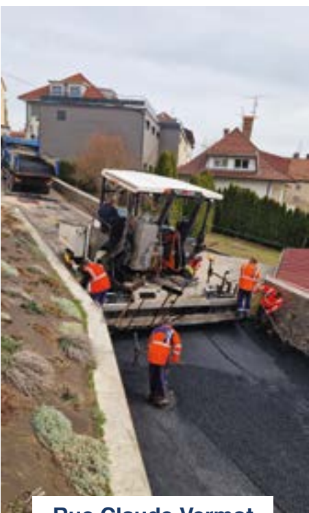
Rue Claude Vermot