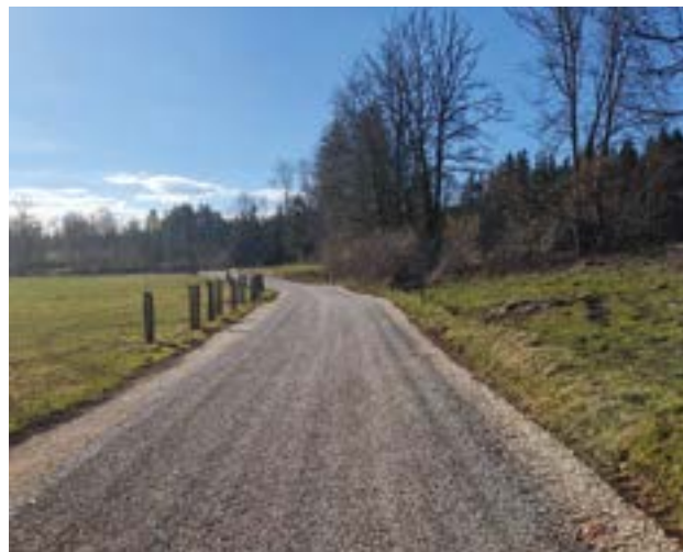
Route de Chez Ducreux