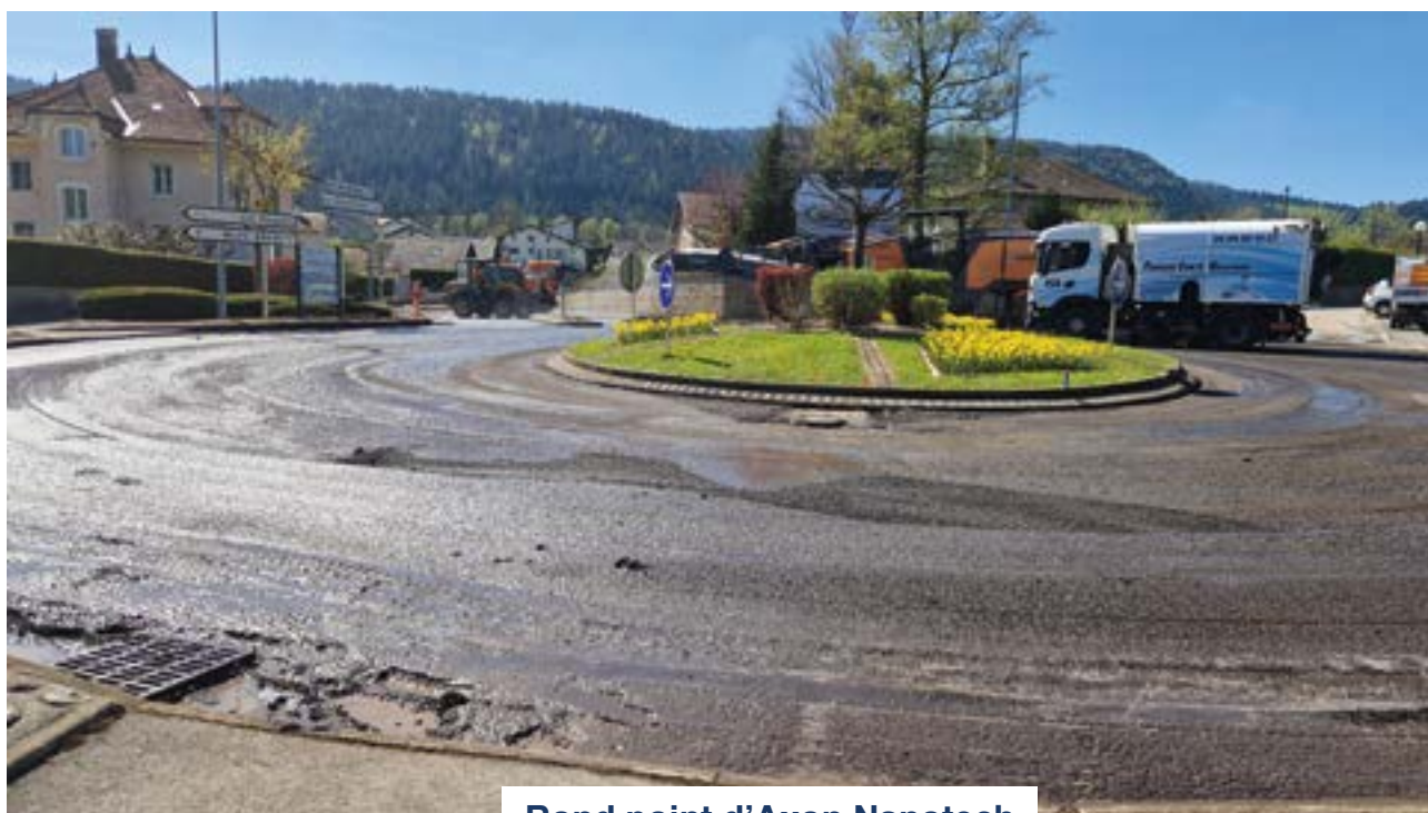
Rond point d'Axon Nanotech