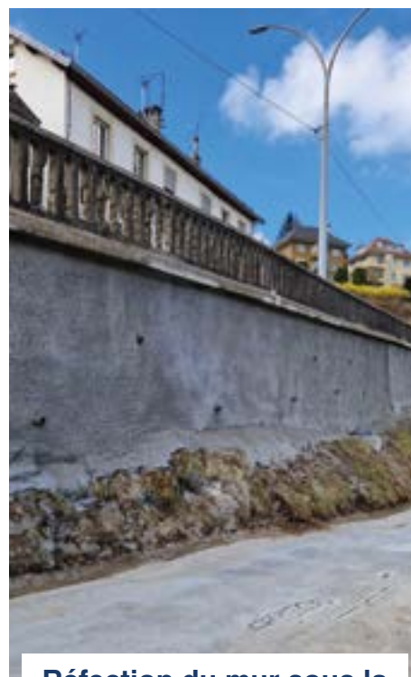
Réfection du mur sous la Route du Quartier Neuf