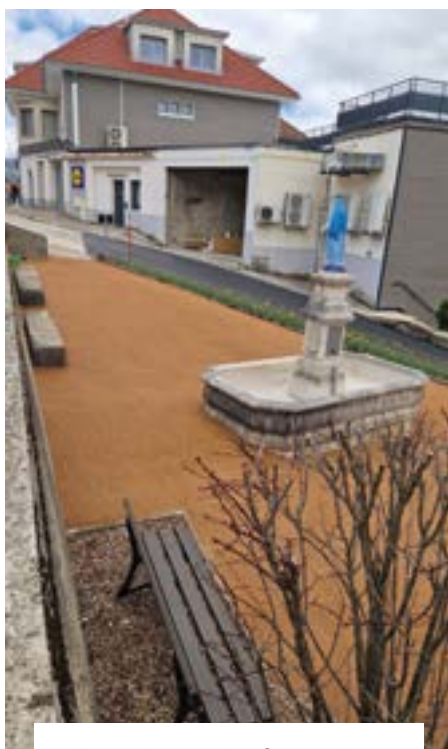
Parvis de la fontaine sous la Mairie