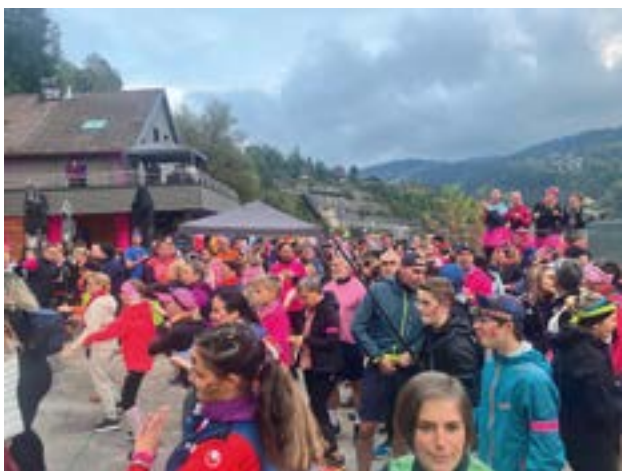
Départ de la course avec les coureurs en rose

Après avoir rejoint le restaurant du port en bateau, les coureurs et marcheurs ont sillonné 8 ou 11 km le long des rives du Saut du Doubs, illuminé d'une lumière rose féérique, symbole de solidarité envers les femmes victimes du cancer du sein. La soirée a ainsi mêlé sport, engagement citoyen et spectacle visuel, offrant un moment unique aux participants et aux spectateurs.