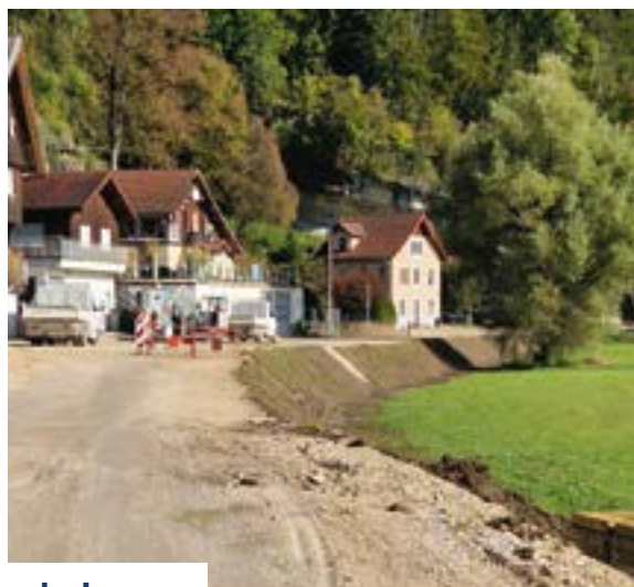
Travaux rue du Lac