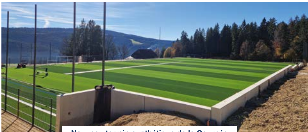
Nouveau terrain synthétique de la Courpée

En conclusion, malgré des contraintes administratives croissantes et des exigences d'études toujours plus nombreuses, la commission poursuit son engagement pour préserver la qualité de vie des Villériers et anticiper les besoins futurs de la commune.