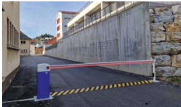
Installation d'une nouvelle barrière

La commune a installé une barrière électrique pour sécuriser l'accès au plateau. Fonctionnant avec une télécommande pour les instituteurs, elle permet de contrôler l'accès tout en laissant aux pompiers la possibilité d'intervenir en cas de besoin.