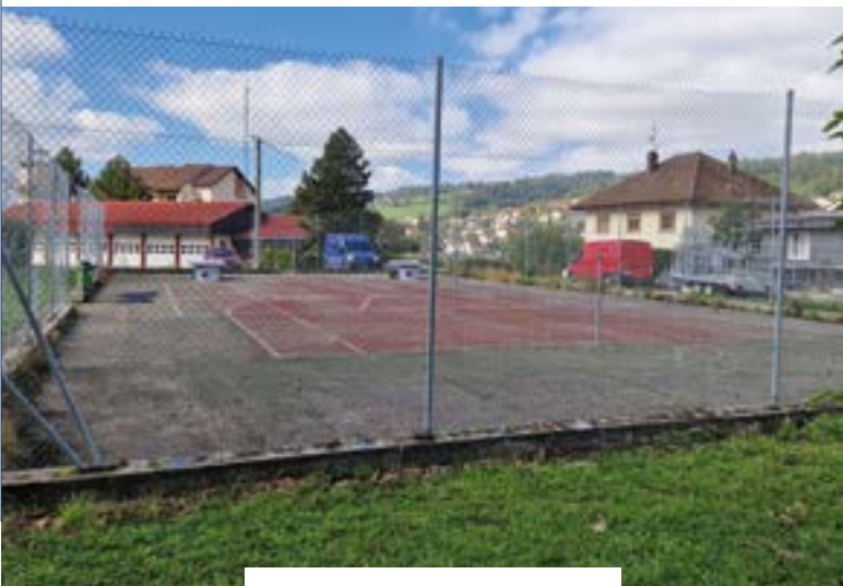
Court de tennis Jean-Claude Moyse