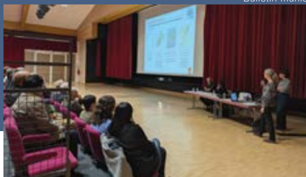
Réunion publique du 28 octobre 2025

Au total, 24 réunions publiques ont été organisées sur l'ensemble du territoire, dont celle de Villers-le-Lac le 28 octobre dernier. L'objectif est de parvenir à la « levée de stylo » et à l'arrêt du PLUi-H début 2026, puis de consacrer le reste de l'année à la validation par les conseils municipaux, à la consultation des Personnes Publiques Associées (PPA) et à l'enquête publique, avant une approbation attendue début 2027.